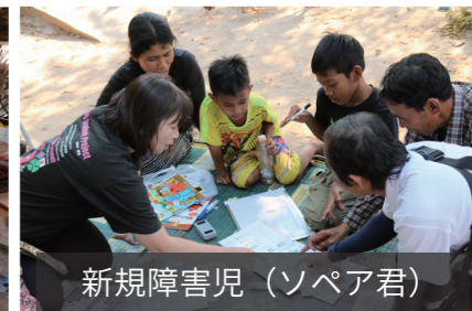
新規障害児 (ソペア君)