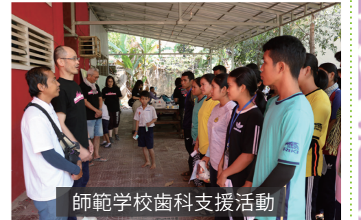
師範学校歯科支援活動