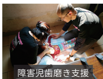
障害児歯磨き支援

デイサービスでの歯磨きは時間をかけることができ、みんなの歯磨きができたことはいけなかったです。回数を重ねてきたからなのか、みんなが慣れてきてくれて、上手にさせてもらえました。お母さんたちが普段がんばってしてもらえているのが、子供たちを見てるとよくわかります。「継続は力なり」です。